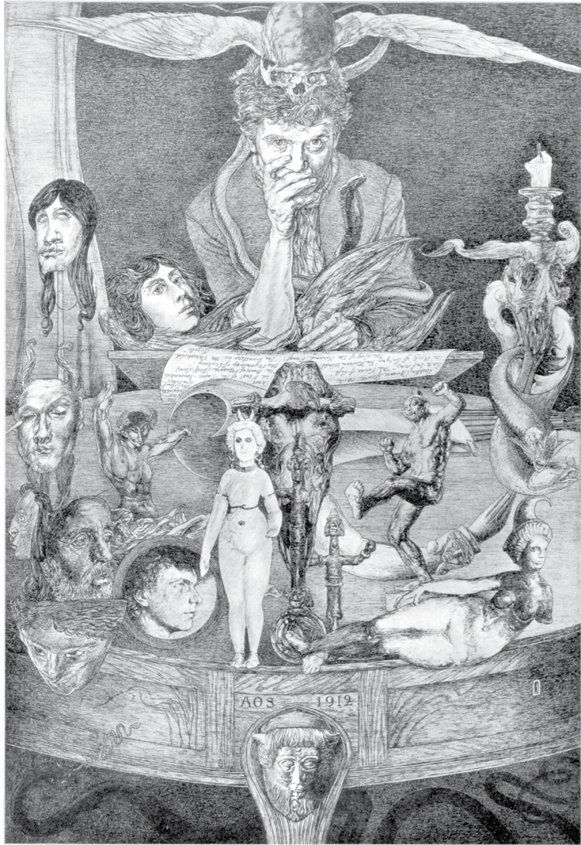
La Posture de la Mort (Autoportrait) [frontispice du Livre du Plaisir ], 1913