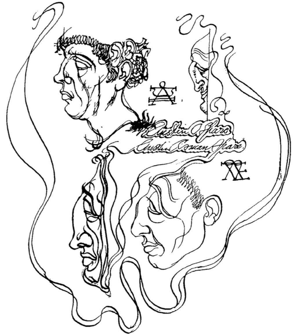
Masques [dessin automatique], date inconnue